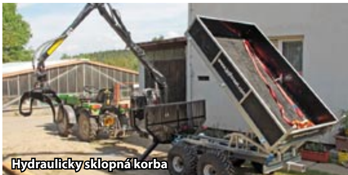
Hydraulicky sklopná korba