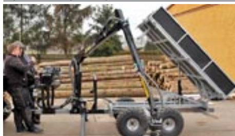
Hydraulicky sklopná korba