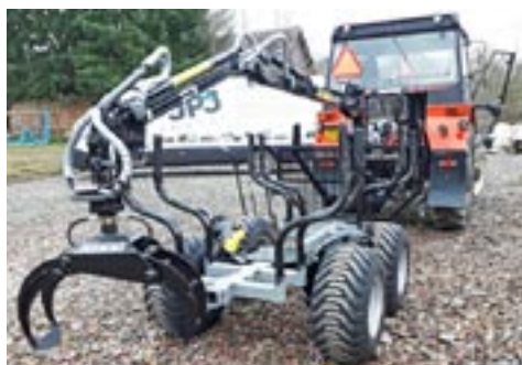
Vahva Jussi 320/2000