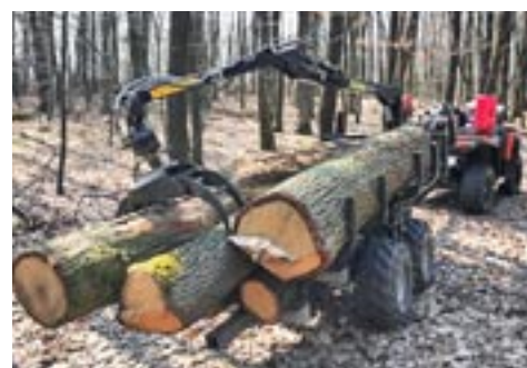
Vahva Jussi 320/2000