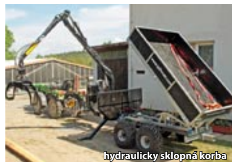
hydraulicky sklopná korba