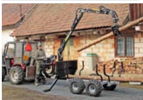
Vahva Jussi 320/2000+