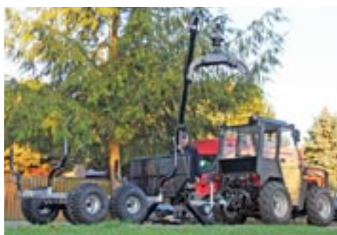
Vahva Jussi 400/1500