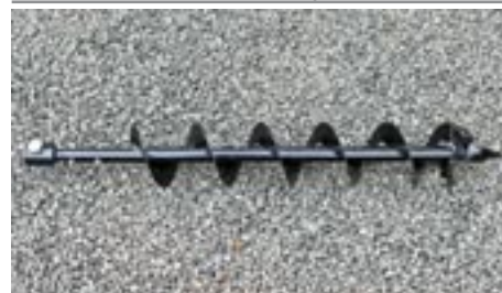
Vrták VJ (10, 15 a 20 cm průměr)