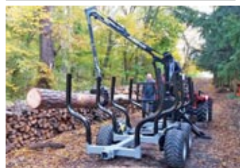
Vahva Jussi 400/2000+