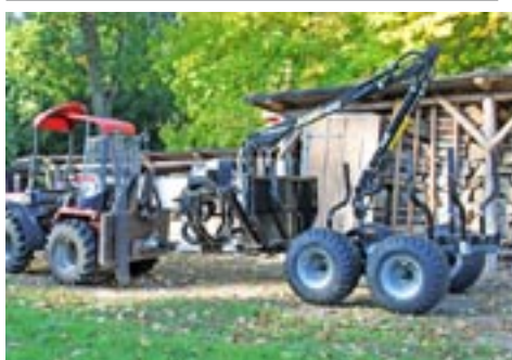
Vahva Jussi 320/1500 4WD