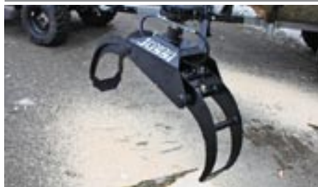
Kulatinový drapak VJ 0,08