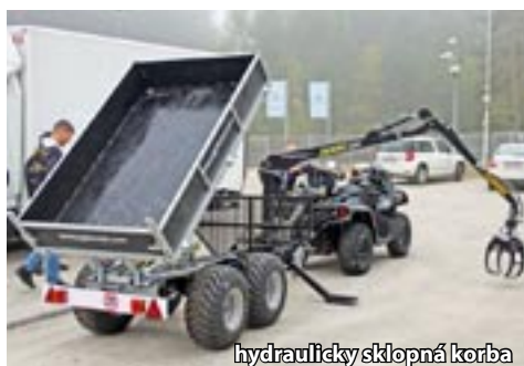
Vahva Jussi 320/2000