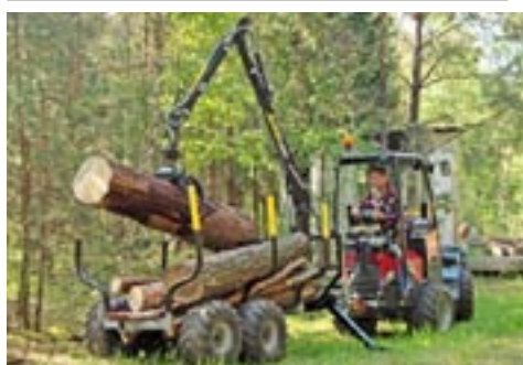
Vahva Jussi 400/1500