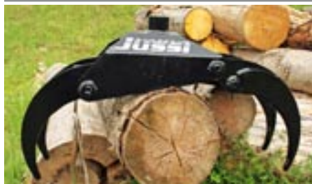
Drapak na klest VJ 0,08