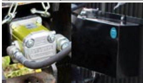
Hydraulické čerpadlo na PTO