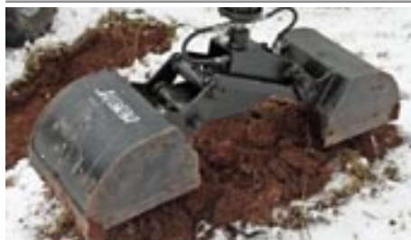
Nakladač Vahva Jussi