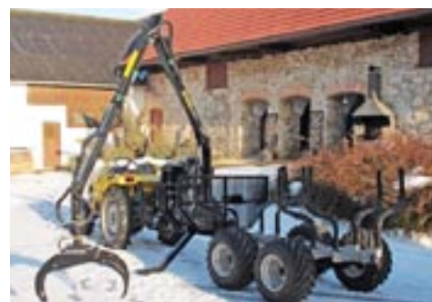
Vahva Jussi 320/1500