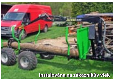
instalována na zákazníkuv vlek