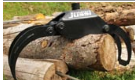
Kulatinový drapak VJ 0,12