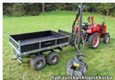
hydraulicky sklopná korba