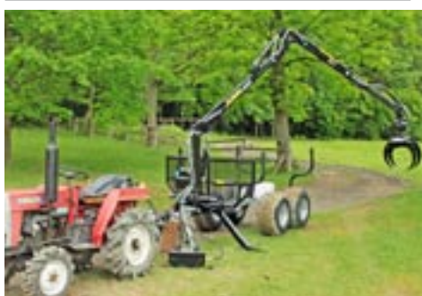
Vahva Jussi 400/2000+