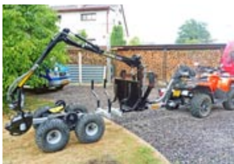
Vahva Jussi 400/2000+